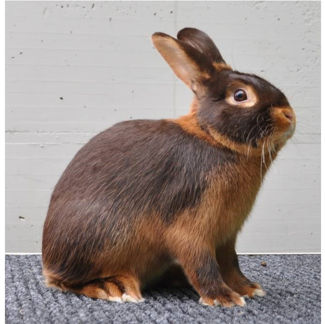
Mister KVV von Ruth Morgenthaler

Ich möchte dem KTZV Sursee Dankeschön sagen für die tolle Ausstellung. Die KVV-Stämmeschau war sicher ein Erfolg. Ich möchte allen Ausstellern gratulieren und danke fürs Mitmachen. Die Ehrungen folgen.